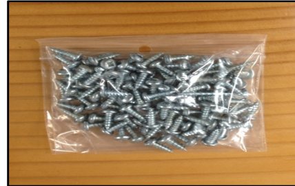
-Vis #8 x 1/2" Pan pour MAB PVC