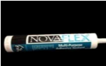
Tube de Silicone